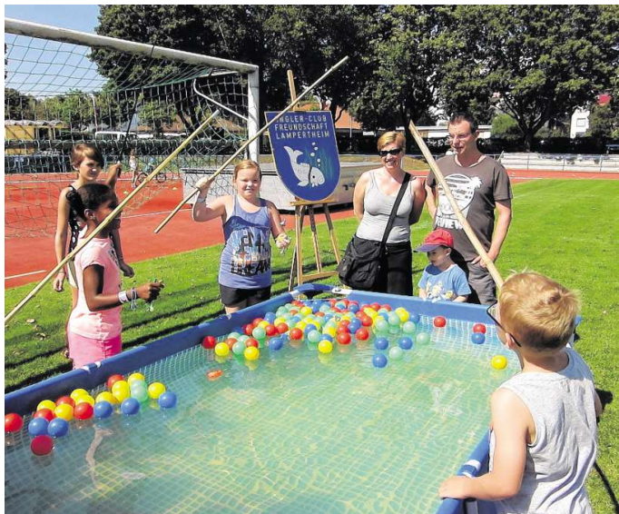
Bei der Kinderolympiade im Adam-Günderoth-Stadion geht's spielerisch zu: Beim Angler-Club Freundschaft gilt es, möglichst viele Plastikfische aus dem Bassin zu angeln.